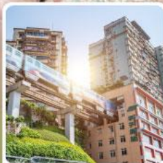
รถไฟฟ้าทะเลตุ๊ตัก