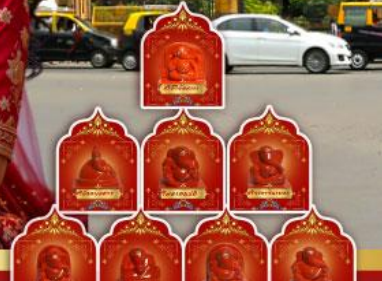
พระพิฆเนศ 8 องค์ เมืองปูเน่