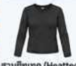
สวมฮีตเทค (Heattech) แบบหนาพิเศษด้านใน