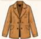
เสื้อแจ็กเก็ต หรือโค้ทตัวยาว