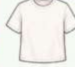
เสื้อยืด