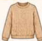
เสื้อไหมพรม