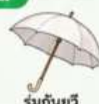
ร่มกันยูวี