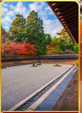
วัดเรียวอันจิ