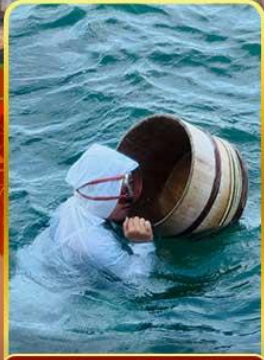
เกาะไข่มุก (โซวามะ)