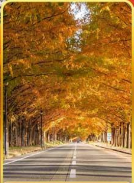
เมตาเซควอยานามิกิ

ออนเซ็น 3 คั้น บน.กระเป๋า 1 ใบ 23 กก. 7Days 5Night