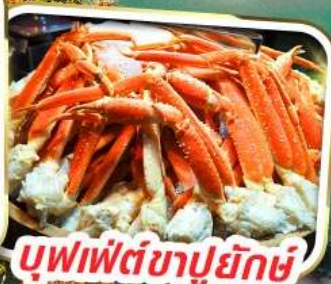
บุฟเฟ่ต์ซาปูยักษ์