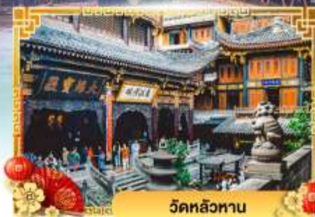
วัดหลัวฮาน