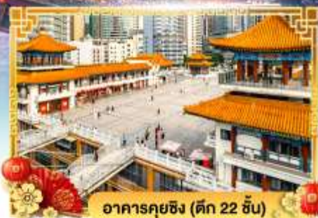
อาคารคุยซิง (ดิค 22 ชั้น)