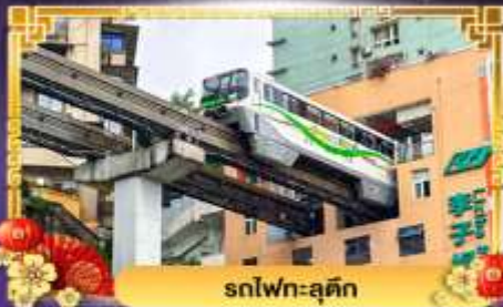
รถไฟฟ้า-ลูตึก