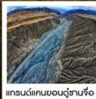
แกรนด์แคนยอนตู้ซานจื่อ