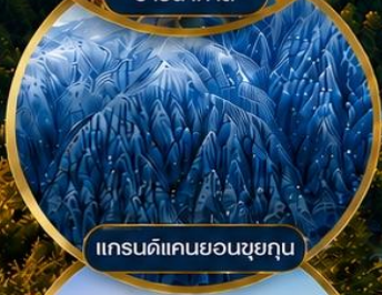
แกรนด์แคนยอนซูยคุน