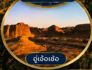
อู่เจ้อเซ่อ