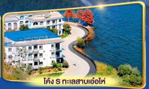
โค้ง S ทะเลสาบเอ่อไห่