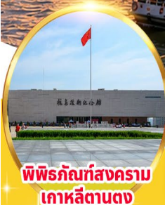
พิพิธภัณฑ์สงคราม เกาหลีตานตง