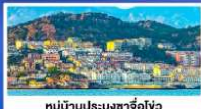
หมู่บ้านประมงซาโจ่ว