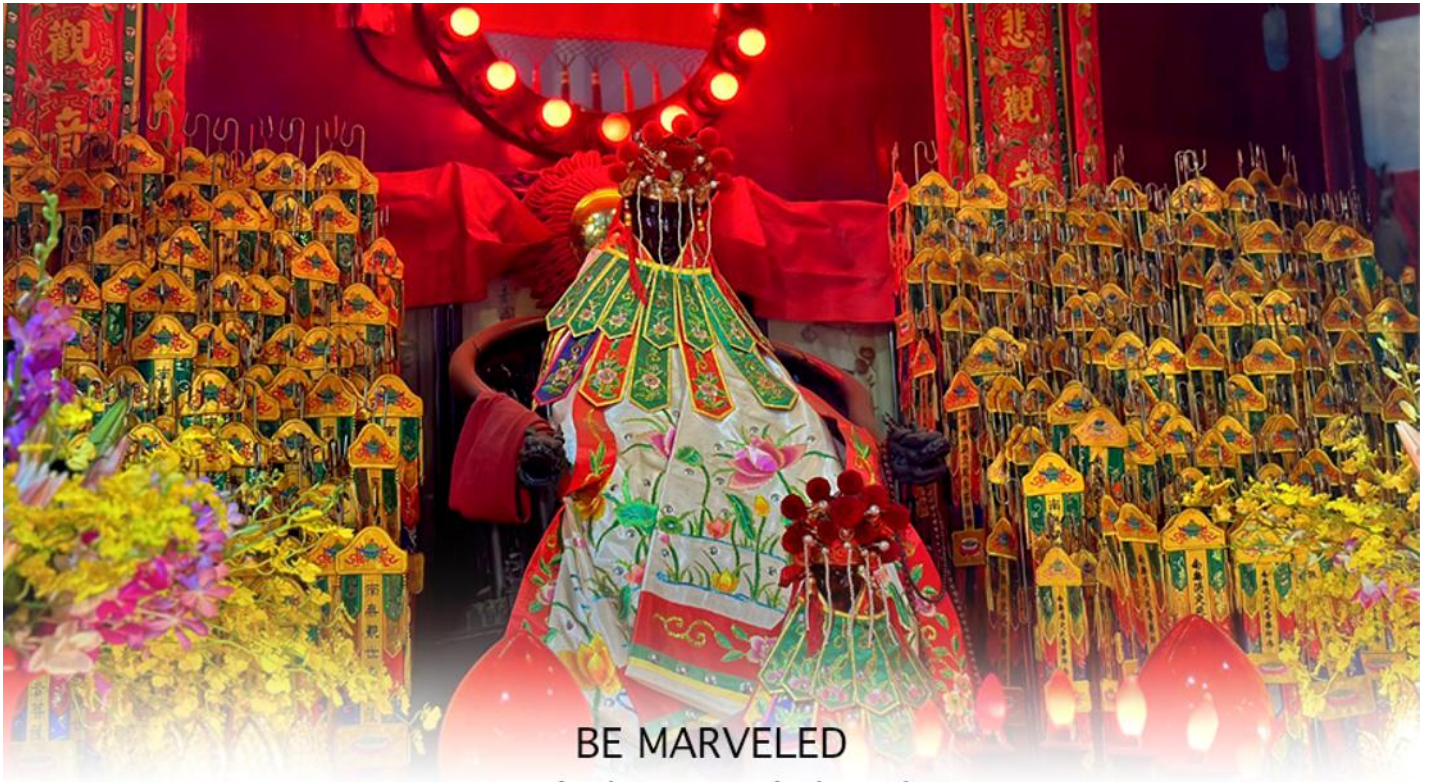
BE MARVELED วัดเจ้าแม่กวนอิมฮวงอ้า (ยิมจิน)

ให้เดินทางกลับไปกราบไหว้ และขอบคุณเจ้าแม่กวนอิมอีกครั้ง โดยเตรียมชุดไหว้ และกระดาษาเงินกระดาษาทอง ที่เป็นเหมือนเงินที่เรานำมาคืน เป็นการไหว้เพื่อคืนเงินเจ้าแม่กวนอิมนั่นเอง