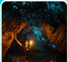
ถ้ำทอนเรืองแสง ไวโตโม