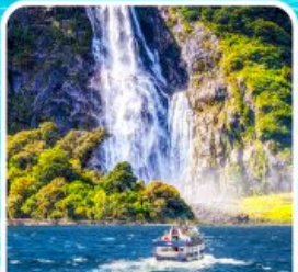
บิลฟอร์ด ซาวด์ นั่งเรือชมความงาม ฟยอร์ด