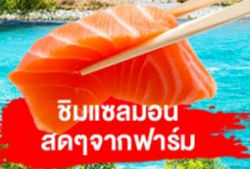
ชิมแซลมอน สดๆจากฟาร์ม