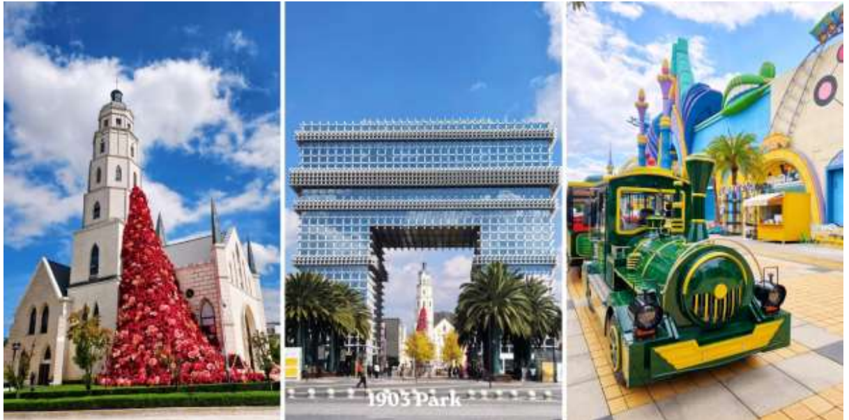
วัดหยวนทง – PARK1903 – สนามบินคุนหมิงฉางชู่ย – กรุงเทพฯสุวรรณภูมิ (อิสระอาหารกลางวัน)

จากนั้นนำท่านสู่ Park 1903 (สวน 1903) แลนด์มาร์คสุดชิค ได้กลิ่นอายยุโรปและศูนย์การค้าไลฟ์สไตล์ใจกลางเมืองคุณหมิง (มณฑลยูนนาน) ที่โดดเด่นด้วยการจำลองสถาปัตยกรรมสไตล์ยุโรป ผสมผสานศิลปะ ความบันเทิง และสวนสนุกเข้าไว้ด้วยกันอย่างลงตัว สถาปัตยกรรมจำลอง ประตูชัยปารีส อันโด่งดังโบสถ์คริสต์ (Gospel Auditorium) และพื้นที่จัดแสดงนิทรรศการPop Mart สาขาใหญ่ สำหรับสายอาร์ตทอยสวนสนุก Dream Park: สวนสนุกที่มีทั้งโซนในร่มและกลางแจ้ง (ตั๋วไม่รวมค่าเข้าสวนสนุก)เป็นแหล่งเสื้อผ้าแบรนด์เนมทั้งของจีนและต่างประเทศ เครื่องประดับอัญมณีชิ้นเยี่ยม ร้านเครื่องดื่ม ร้านอาหารพื้นเมือง