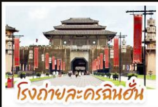
โรงถ่ายละครฉินฮั่น

ชมวิวน้ำตกบ้านม้งซีเจียงพันหลังคา • อุทยานเสี้ยวซิ่ง มนต์เสน่ห์จิวจิวโกวน้อย • อิสระช้อปปิ้งกับถนนคนเดิน สามตรอกสองซอย • สูดอากาศให้เต็มปอดบนยอดเขาชิงซิ่ง พร้อมชมความสวยงามของมวลดอกไม้ตามฤดูกาล