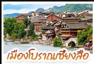
เมืองโบราณชิงสือ