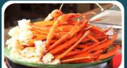
ชาบูบุฟเฟ่ต์