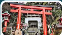
ศาลเจ้าอิโนะชิมะ

เดินทาง 01-05 ก.ค.69 15-19, 18-22 ก.ค.69