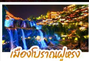
เมืองโบราณผู่แรง