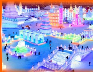
เที่ยว ICE & SNOW WORLD