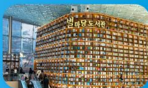
ห้องสมุดสตาร์ฟิลา