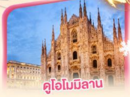
คูโอโมมิลาโน