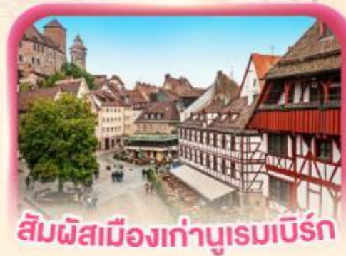
สัมผัสเมืองเก่าบูเรมเบิร์ก