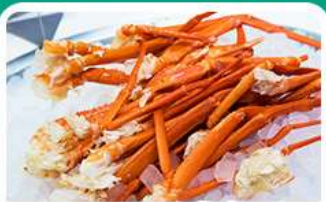
พิเศษ! บุฟเฟ่ต์งาปู