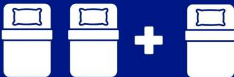
ห้องพักสำหรับสามท่าน (ที่นอนเสริม) TRIPLE BED ROOM (TRP)