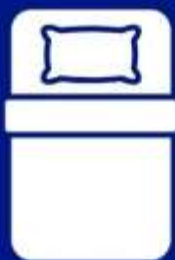
ห้องพักเดี่ยว SINGLE BED ROOM (SGL)

ห้องพักสำหรับ 1 ท่าน มีค่าใช้จ่ายเพิ่มจากค่าทัวร์