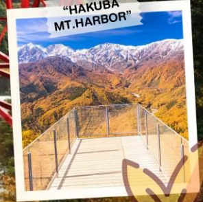
"HAKUBA MT. HARBOR"

วันเดินทาง 28 ต.ค. - 3 พ.ย. 2569 4 - 10 , 11 - 17 พ.ย. 2569