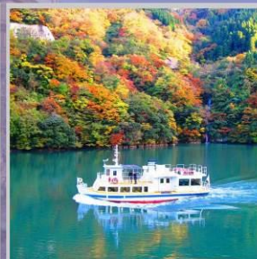
"SHOGAWA YURAN CRUISE"