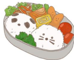
● อาหารสำหรับเด็ก ( 2-11 ปี ) *วัตถุประสงค์ขึ้นอยู่กับทาว์ราน