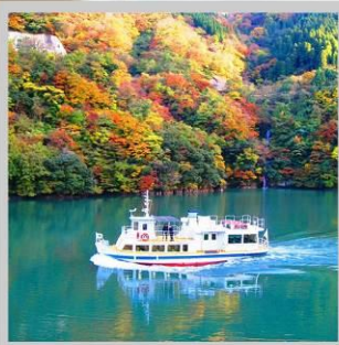
“SHOGAWA YURAN CRUISE”