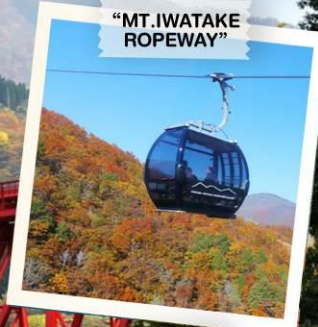
"MT. IWATAKE ROPEWAY"