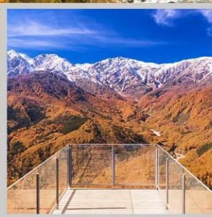
“HAKUBA MT. HARBOR”