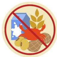
● แพ้อาหาร / อื่นๆโปรดระบุ