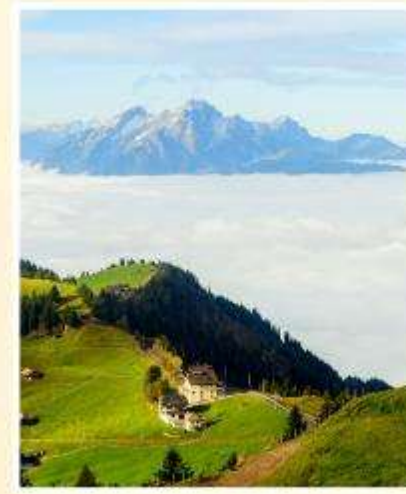
RIGI KULM Queen of the Mountains