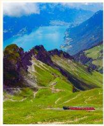
BRIENZER ROTHORN Sorenberg Schonenboden