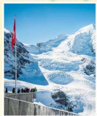
DIAVOLEZZA Piz bernina Peak