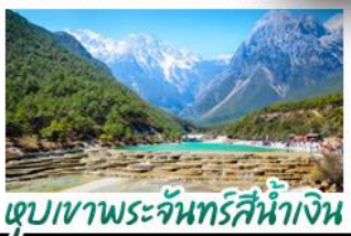
ภูเขาพระจันทร์สีน้ำเงิน