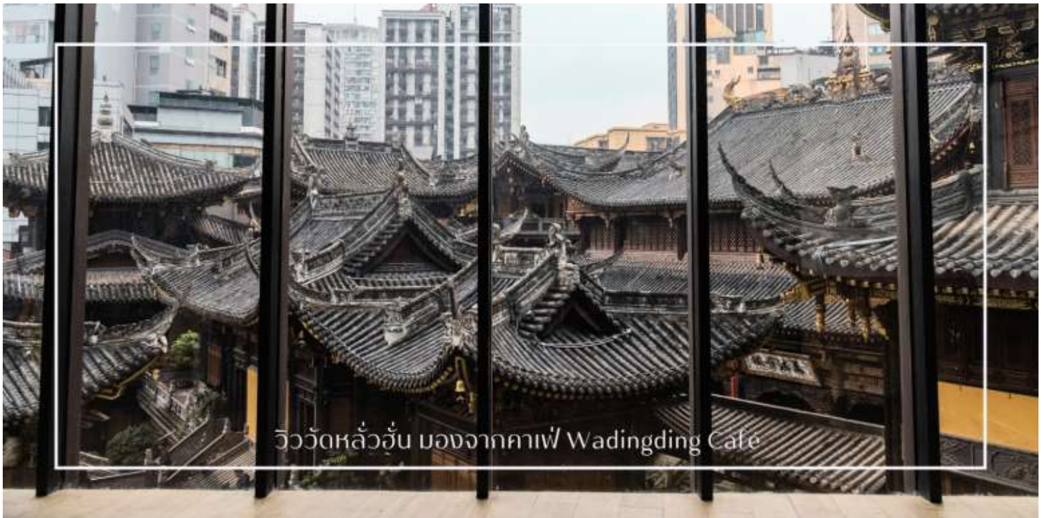
วิววัดหลัวฮั่น มองจากคาเฟ่ Wadingding Cafe

นำท่านสู่ท่าทางเดินทางสู่ คาเฟ่ Wa Ding Ding Cafe สัมผัสประสบการณ์จิบกาแฟในบรรยากาศที่ผสมผสานระหว่างโลกอนาคต และอดีต อย่างลงตัว บนชั้นดาดฟ้าตึก S95 ย่านเจียฟางเปย ไฮไลท์คือการชมวิว "วัดหลัวฮั่น"วัดเก่าแก่พันปีผ่านกรอบกระจกบานใหญ่ ที่ได้รับการขนานนามว่าเป็นหนึ่งในจุดถ่ายรูปที่สวยงามที่สุดของมหานครฉงชิ่ง ให้ท่านได้เก็บภาพความประทับใจของหลังคาวัดสีทองอร่ามที่ตัดกับตึกสูงระฟ้าใจกลางเมือง พร้อมดื่มด่ำกับเครื่องดื่มที่รังสรรค์มาอย่างพิถีพิถัน