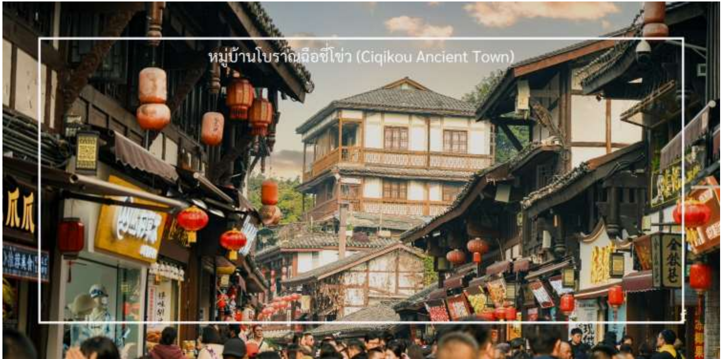
หมู่บ้านโบราณฉือชิว (Ciqikou Ancient Town)

นำท่านสู่ท่าทางเดินทางสู่ คาเฟ่ Wa Ding Ding Cafe สัมผัสประสบการณ์จิบกาแฟในบรรยากาศที่ผสมผสานระหว่างโลกอนาคต และอดีต อย่างลงตัว บนชั้นดาดฟ้าตึก S95 ย่านเจียฟางเปย ไฮไลท์คือการชมวิว "วัดหลัวฮั่น"วัดเก่าแก่พันปีผ่านกรอบกระจกบานใหญ่ ที่ได้รับการขนานนามว่าเป็นหนึ่งในจุดถ่ายรูปที่สวยงามที่สุดของมหานครฉงชิ่ง ให้ท่านได้เก็บภาพความประทับใจของหลังคาวัดสีทองอร่ามที่ตัดกับตึกสูงระฟ้าใจกลางเมือง พร้อมดื่มด่ำกับเครื่องดื่มที่รังสรรค์มาอย่างพิถีพิถัน