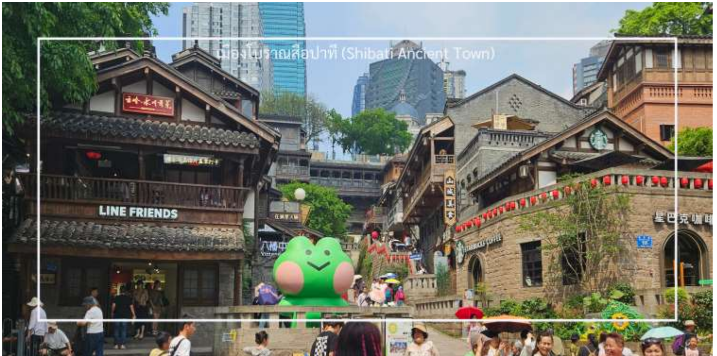
เมืองโบราณสีปาตี (Shibati Ancient Town)

นำท่านเที่ยวชม เมืองโบราณสีปาตี (Shibati Ancient Town) ตั้งอยู่ในเขตฉงชิ่ง (Chongqing) เป็นเมืองโบราณที่มีเสน่ห์และเต็มไปด้วยประวัติศาสตร์ อดีตของเมืองนี้ย้อนกลับไปหลายร้อยปี และมีการอนุรักษ์สถาปัตยกรรมแบบดั้งเดิมไว้เป็นอย่างดี เมืองนี้มีบ้านเรือนและอาคารที่สร้างขึ้นในสไตล์จีนโบราณ ซึ่งมีลักษณะเฉพาะที่สะท้อนถึงวัฒนธรรมและประเพณีท้องถิ่น และยังมี ถนนในเมืองโบราณสีปาตีที่มีความคดเคี้ยวและเต็มไปด้วยร้านค้า ร้านอาหาร และคาเฟ่ที่ขายสินค้าท้องถิ่น