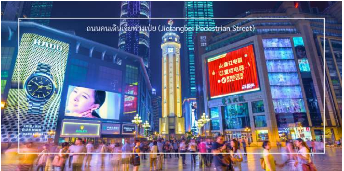
ถนนคนเดินเจี๋ยฟางเป่ย์ (Jiefangbei Pedestrian Street)