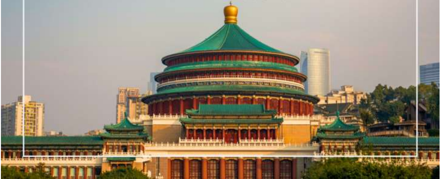
มหาศาลาประชาชนแห่งเมืองฉงชิ่ง (Chongqing People's Grand Hall)

นำท่านเที่ยวชม เมืองโบราณสีปาตี (Shibati Ancient Town) ตั้งอยู่ในเขตฉงชิ่ง (Chongqing) เป็นเมืองโบราณที่มีเสน่ห์และเต็มไปด้วยประวัติศาสตร์ อดีตของเมืองนี้ย้อนกลับไปหลายร้อยปี และมีการอนุรักษ์สถาปัตยกรรมแบบดั้งเดิมไว้เป็นอย่างดี เมืองนี้มีบ้านเรือนและอาคารที่สร้างขึ้นในสไตล์จีนโบราณ ซึ่งมีลักษณะเฉพาะที่สะท้อนถึงวัฒนธรรมและประเพณีท้องถิ่น และยังมี ถนนในเมืองโบราณสีปาตีที่มีความคดเคี้ยวและเต็มไปด้วยร้านค้า ร้านอาหาร และคาเฟ่ที่ขายสินค้าท้องถิ่น