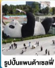
รูปปั้นแพนด้าเซลฟี่