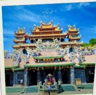
วัดกวนตู่