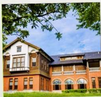
พิพิธภัณฑ์น้ำพุร้อนเป่ย์โถว