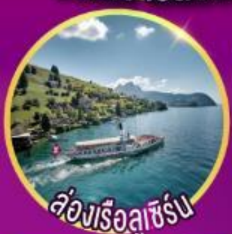
ล่องเรือลูซิเิร์น