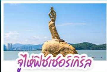
จุ๊เซ่ฟิซซอร์เทิร์ล