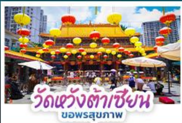
วัดแห่งต้าเซียน บอพรสุขภาพ