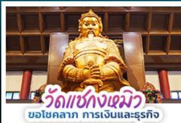
วัดแชกงเมียว ขอโชคลาภ การเงินและธุรกิจ