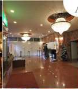
Asia Narita Hotel