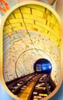
อุโมงค์แม่เหล็ก