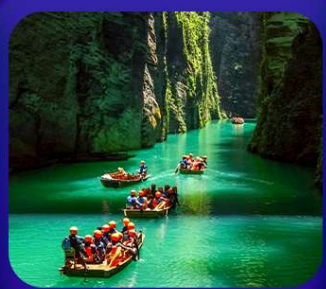
" ผิงซานแกรนด์แคนยอน "

เที่ยวจีน 2 มณฑล เสฉวน+หูเป่ย์ • ถ้าถึงหลง • หุบเขาสิงโต ซื่อจื่อกวน ล่องเรือมังกรกั๋งสู่ผิงซานแกรนด์แคนยอน (รวมล่องเรือ) หงหยาดัง • จุดชมรถไฟฟ้าทะลุหิน • ตึกตะเกียบ • สือปาตี • หลงเหมินฮ่าว