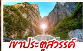
เขาประตูสวรรค์