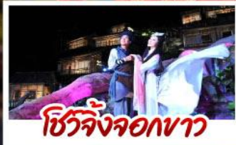
ชีวิตจริงจอกขาว