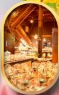
พิพิธภัณฑ์ถ้ำลอดดนตรี