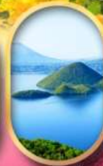
วิวทะเลสาบโทโยะ