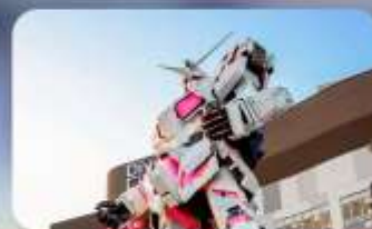
ช้อปปิงโอไดบะ