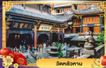
วัดหลิวหนาน