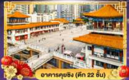
อาคารคุยจิง (ตึก 22 ชั้น)