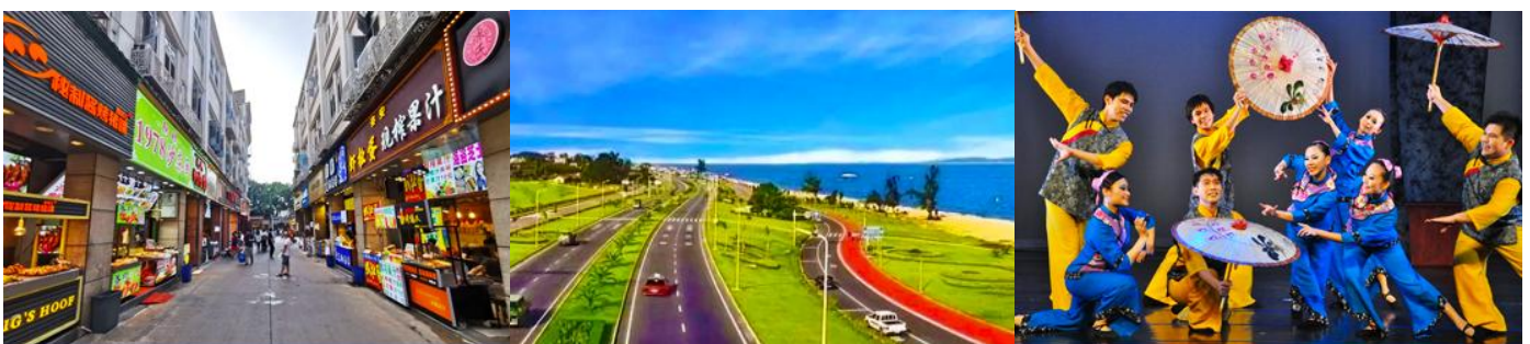
ถนนวซาลู่

พักที่ โรงแรม XIAMEN HENGLONG HOTEL 4* หรือเทียบเท่าในเมืองเซี่ยเหมิน