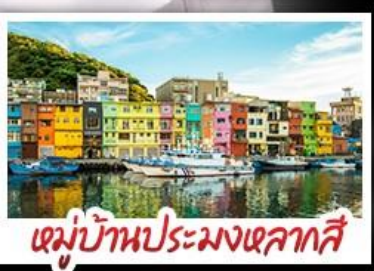
เมืองโบราณจีวเฟิน