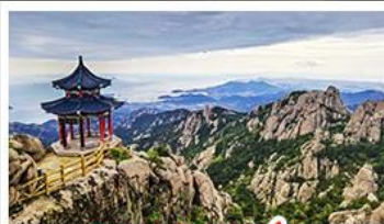
ภูเขาเลาซาน