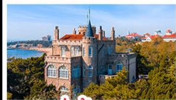
ป่าตึกวน

พระราชวังฤดูร้อน - วิวเมืองสิงเต่า รถไฟความเร็วสูง - ภูเขาเลาซาน กำแพงเมืองจีนด่านจวิยงกวน - ป่าตึกวน พักโรงแรมระดับ 4 ดาว - ไม่หลงร้านช้อปปิ้ง มือพิเศษ เปิดปักกิ่ง, หม้อไฟซีฟู้ด