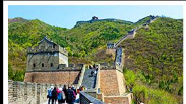
กำแพงเมืองจีนด่านจวิยงกวน