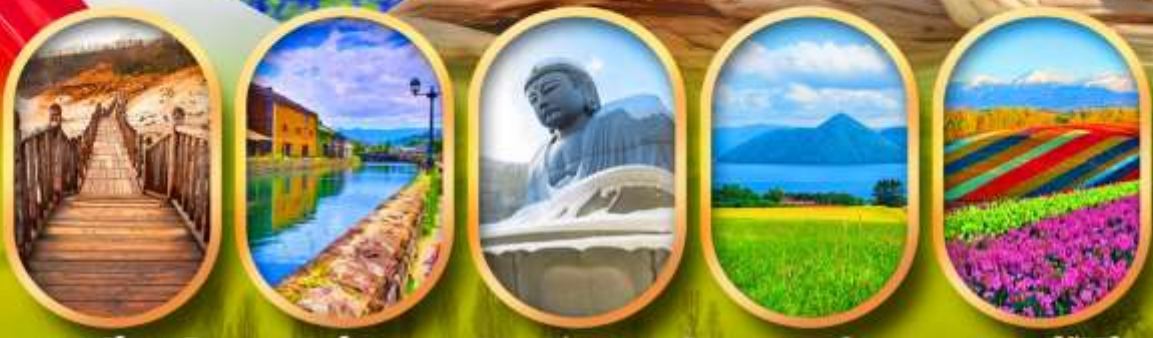
หุบเขาจิกอกูดานิ คลองโอตารุ เป็นเขาแห่งพระพุทธรเจ้า ทะเลสาบโทยะ สวนดอกไม้ซึกิโซ