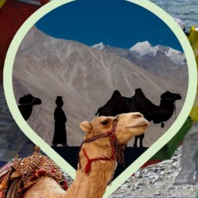
ซิลลี่ ซ็อฐู ทะเลทราย กลางอ้อมกอดหิมาลัย