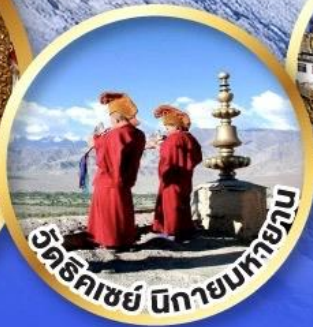
วัดริคเชย์ นิกายมหายาน