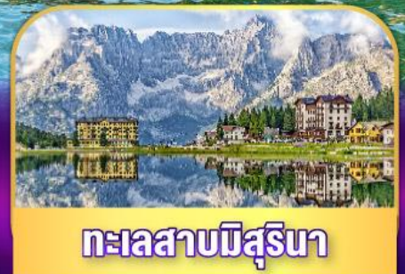
ทะเลสาบมิสุรีนา