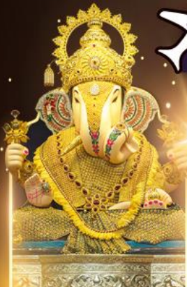
องค์ดีกษุท์เศษฐ์