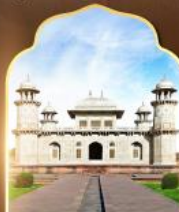
ทัชมาฮาลน้อย