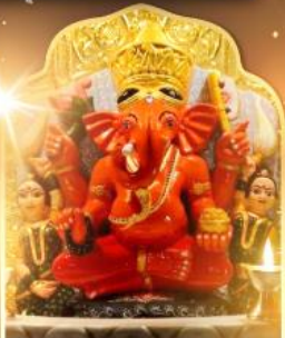
องค์สิทธีวินายก