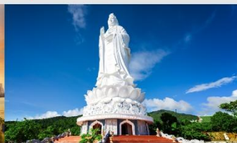
วัดลินห์ฮิ่ง

*ทางบริษัทฯ ขอสงวนสิทธิ์ในการสลับโปรแกรมทัวร์ตามความเหมาะสมขึ้นอยู่กับสถานการณ์หน้างาน โดยคำนึงถึงผลประโยชน์ของลูกค้าเป็นสำคัญ