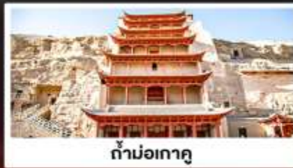
ถ้ำมอเกาตุ