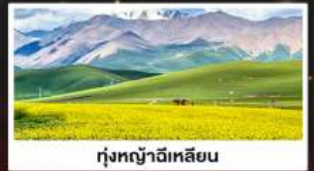
ทุ่งหญ้าจีเหลียน