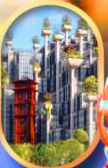
อาคาร 1,000 คับไม้