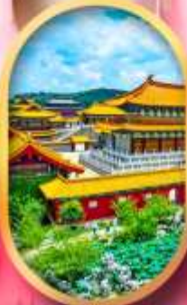
เมืองจำลองสามก๊ก