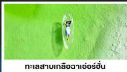
ทะเลสาบเกลือฉาเอ๋อร์อัน