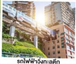
รถไฟฟ้าวิ่งทะลุคิก